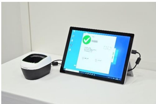
指静脈による本人証明