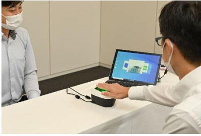
指静脈の事前登録