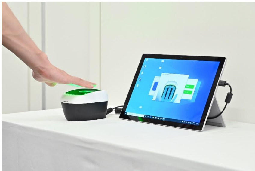
デジタルヘルス証明と生体認証技術を活用した入室管理

9月27日～10月6日には鹿島が所有する「赤坂Kタワー」(東京都港区)にて、実証への協力に同意した同社の従業員を対象に、ワクチン接種履歴などの事前登録から検査の実施、デジタルヘルス証明発行、オフィス入館までの一連の技術検証を実施しました。今後、オフィスなど建物内での実装に向けた準備を進めるとともに鹿島の建設現場などにおいても共同実証を行う予定です。