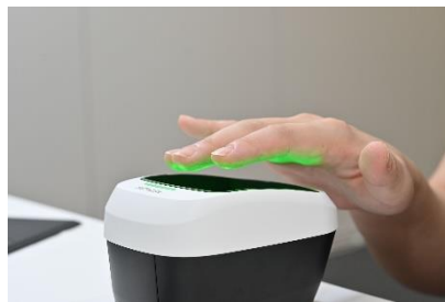
非接触型指静脈認証装置での 指静脈登録