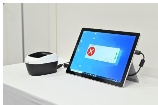
認証後の入室の様子

次回の実証では、デジタル庁が推進する VRS (Vaccination Record System: ワクチン接種記録システム) のワクチン接種履歴とのデータ連携や、国際標準「スマートヘルスカード」に準拠したデータ仕様の実装を予定しています。また、オフィスビル以外の場所(学校・病院・イベントホール・レストラン・観光地・建設現場)など対象範囲を広げるべく検討していきます。