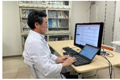
九州大学病院の医師による判定 ※陰性であれば証明発行